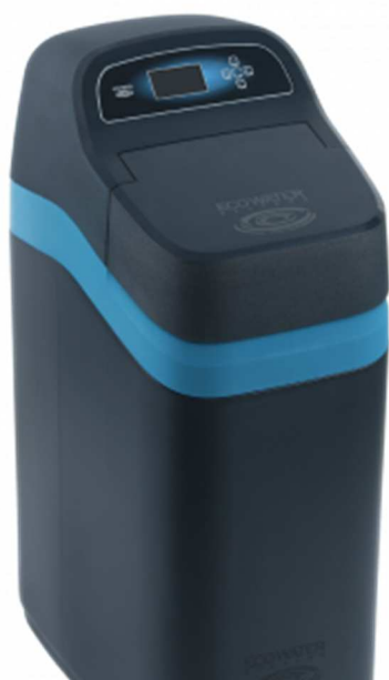
Obr. 1 Změkčovač vody s uhlíkovým filtrem